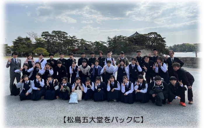
【松島五大堂をバックに】

友人と過ごす3日間。強い絆と友情を育むことができ、思い出に残る修学旅行となりました。