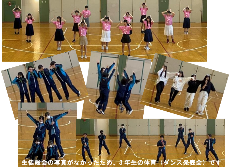
生徒総会の写真がなかったため、3年生の体育（ダンス発表会）です

1年が終わる3月には、夢を達成することができるように、「目配り・気配り・心配り」を大切に、全校生徒で頑張っていきましょう！